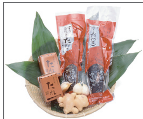
一本釣り 蕪焼き鰹たたき / 梅原 真